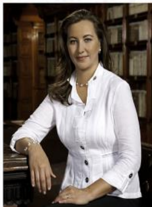
Martha Ericka Alonso Hidalgo Primera mujer gobernadora panista Puebla, 2018