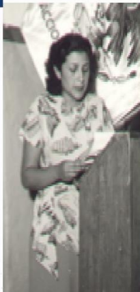
Delfina Botello, candidata a Presidenta Municipal por el municipio de Tacámbaro, Michoacán en 1947.