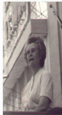
Jovita Granados, candidata a Senadora por el Estado de Chihuahua en 1958.